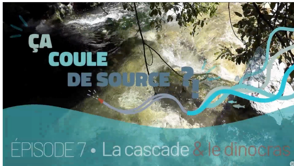
La cascade & le Dinocras , 7 ème épisode de la série Ça coule de source ?! réalisée par FNE PACA

Cette projection a permis d'introduire une partie des sujets abordés ensuite lors de la sortie terrain.